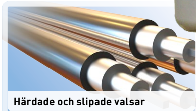
Härdade och slipade valsar