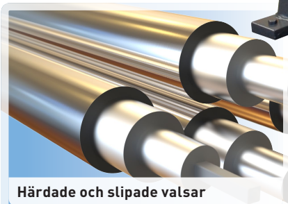
Härdade och slipade valsar